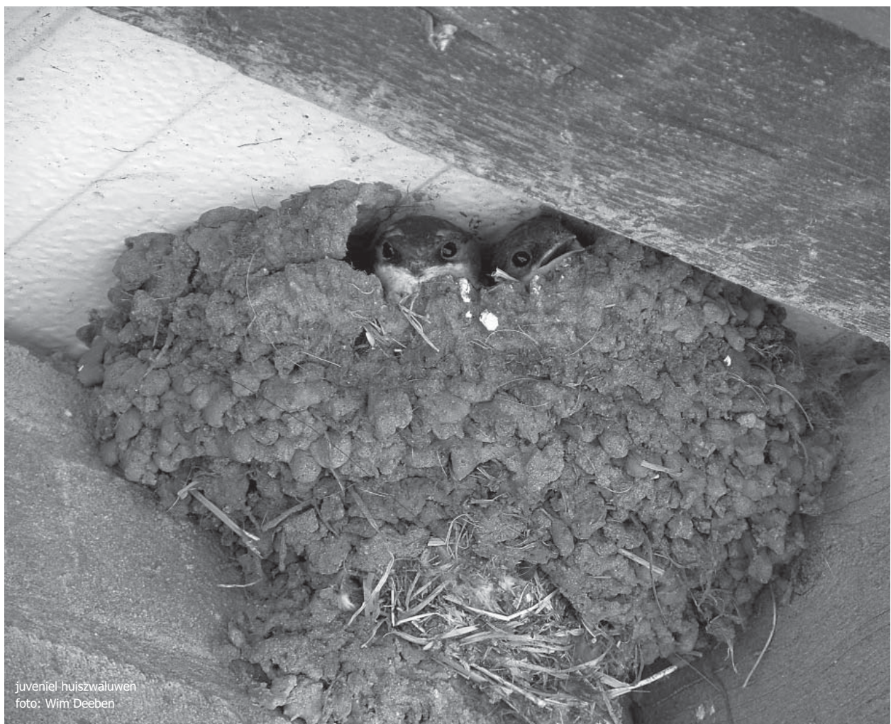
juveniel huiszwaluwen

Deeben, W. 2008. 25 Jaar huiszwaluwen ( Delichon urbica ) in de Kempen. Blauwe Klauwier 34(1): 27-34.