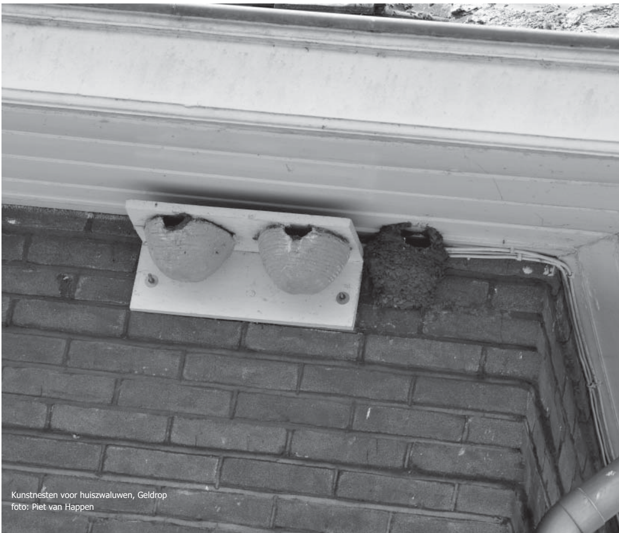
Kunstnesten voor huiszwaluwen, Geldrop