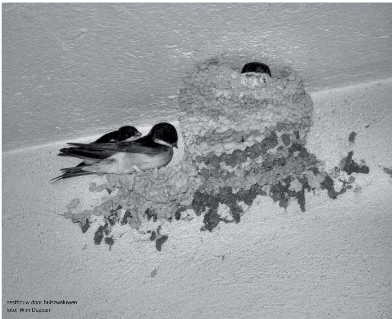
nestbouw door huiszwaluwen