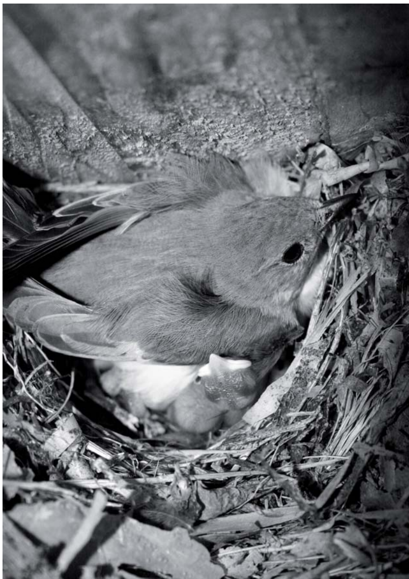
Bonte vliegenvanger

Dus als je eens mee wilt, let dan op de aankondigingen en kom meehelpen. ■